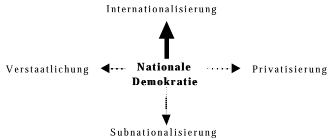
Abbildung 1: Die zwei Achsen des Wandels in der Legitimationsdimension

In dem Teilprojekt B5 kann damit an zwei andere Teilprojekte des Sfb angeknüpft werden: